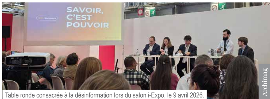
Table ronde consacrée à la désinformation lors du salon i-Expo, le 9 avril 2026.